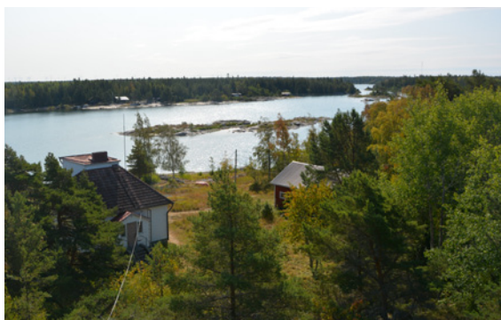
Utsiktstornet på Högklubben är fortfarande öppet för allmänheten och levererar en hänförande utsikt.