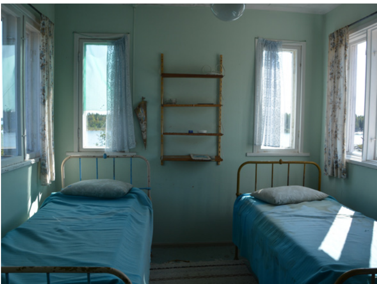
I den stora lotsstugan finns sängplatserna kvar. FOTO: ANDERS BERGVIK

Peder Sahl skulle helst se att Senatsfastigheter skänker Högklubben till Kristinestad. FOTO: ANDERS BERGVIK